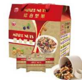
06-24 台酒綜合堅果禮盒 限量