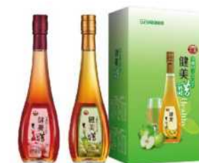
05-04 台酒健美醋禮盒 (水蜜桃、青蘋果各一瓶) 代號: 342055-12、容量: 520ml*2瓶/盒 全素 $320/盒 (售價350元)