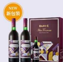
14-06 玉泉極品台灣之美紅葡萄酒禮盒

代號: 224319-14、容量: 0.75L*2+0.18L、酒精濃度: 12%