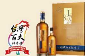
// 13-04 玉尊經典台灣威士忌禮盒