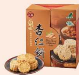
06-02 台酒清酒粕杏仁餅 限量