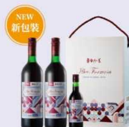
14-04 玉泉台灣之美紅葡萄酒禮盒

精選品質穩定、香氣濃郁的頂級進口Cabernet Sauvignon和Merlot葡萄品種，與台灣本土葡萄完美融合，經低溫釀造、適當時間儲存熟陳，散發出黑櫻桃、李子等果香及淡淡的橡木桶香氣，蘊含豐富多層次的香氣及風味，單寧平衡而優雅，圓潤果香盡情於舌尖翩翩漫舞，充分展現台灣之美。