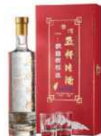
10-03 玉山五糧陳酒禮盒 (添加奈米金)