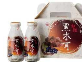
05-05 台酒紅麵黑木耳禮盒 代號: 351375-12、容量: 300g*6瓶/盒 全素 $240/盒 (售價270元)