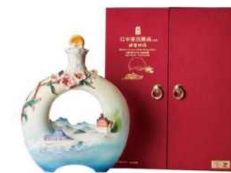
08-05 「明潭映福」 玉山十二年峯頂陳高禮盒 限量

採用法藍瓷為酒器，以台灣著名風景區為創作題材，將日月潭碧綠湖光、層巒疊翠之景，與山櫻花悠然綻放之美，雕琢於瓷瓶上，讓自然之美與藝術創作成就一種豐富的藝術文化饗宴。