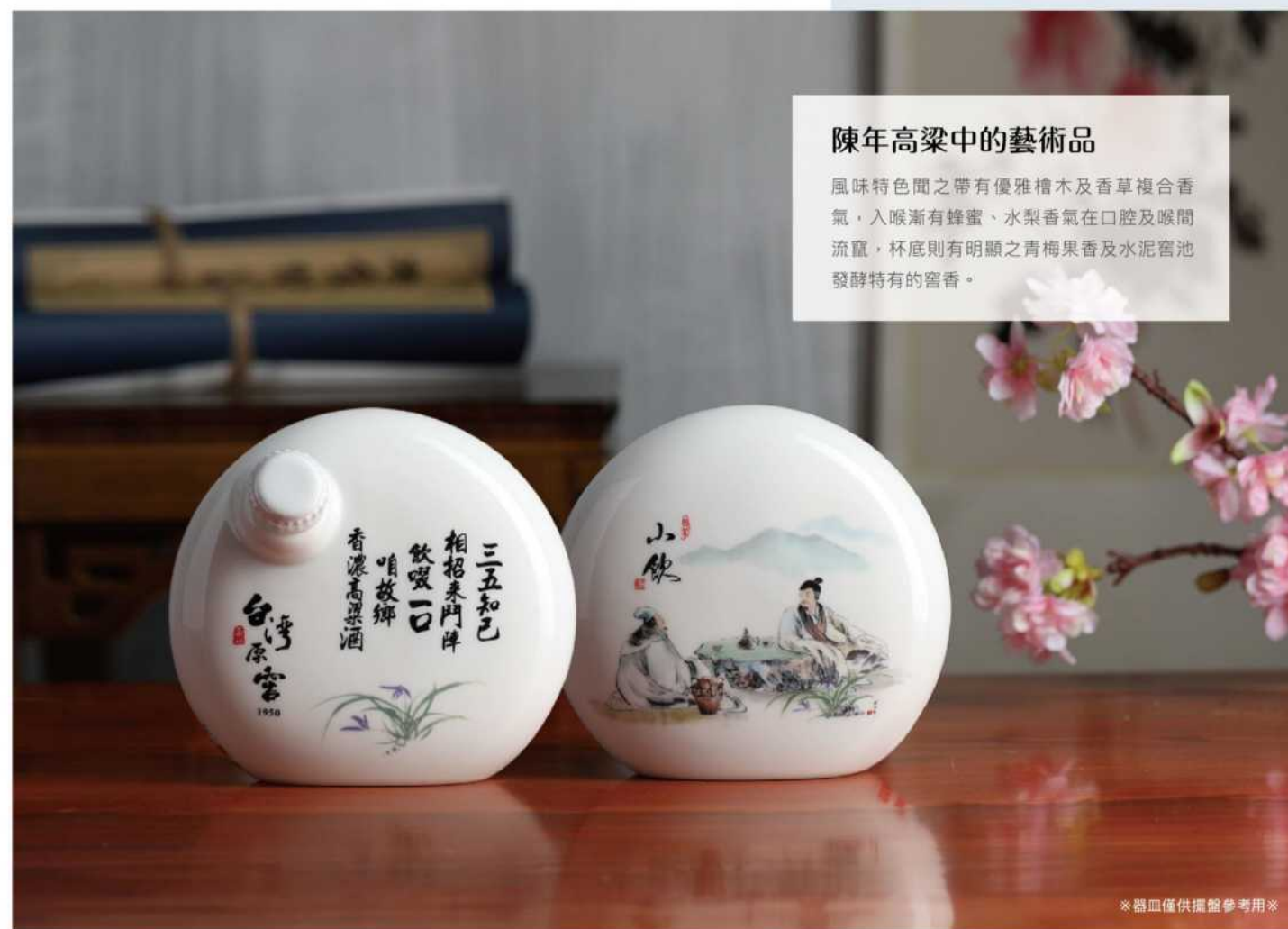
※器皿僅供擺盤參考用※

風味特色間之帶有優雅檜木及香草複合香氣，入喉漸有蜂蜜、水梨香氣在口腔及喉間流竄，杯底則有明顯之青梅果香及水泥窖池發酵特有的窖香。