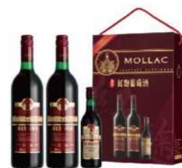
14-03 玉泉紅麴葡萄酒禮盒

代號: 2220Q8-14、容量: 0.75L*2、酒精濃度: 紅麴8.5%、金標紅麴10.5%