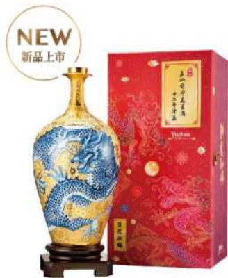
08-03 「雙龍獻瑞」 玉山台灣高粱酒十二年陳高禮盒 限量

瓷瓶由臺華窯手工藝術打造，佐以新彩青花釉彩，以吉祥雙龍迎面承讓龍珠寓意報喜接踵而至，並以立體雕金效果形塑出整體富貴榮華之景致。瓶型源自清代創製之「柳葉瓶」，名稱優雅清麗，瓶身婀娜婉約，今臺華窯改其身，狀似豐腴寓意更是圓融。