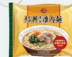
// 07-04 台酒紹興雪菜雞肉麵 (袋) 限購