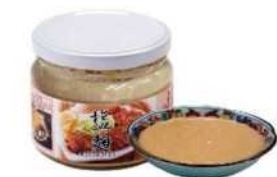
04-04 台酒鹽麵 限量 代號: 350271-12、容量: 300g/罐 $160/罐 (售價180元)