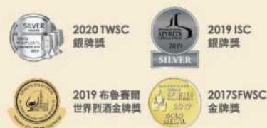
// 13-01 OMAR單一麥芽威士忌禮盒 (雪莉果乾)