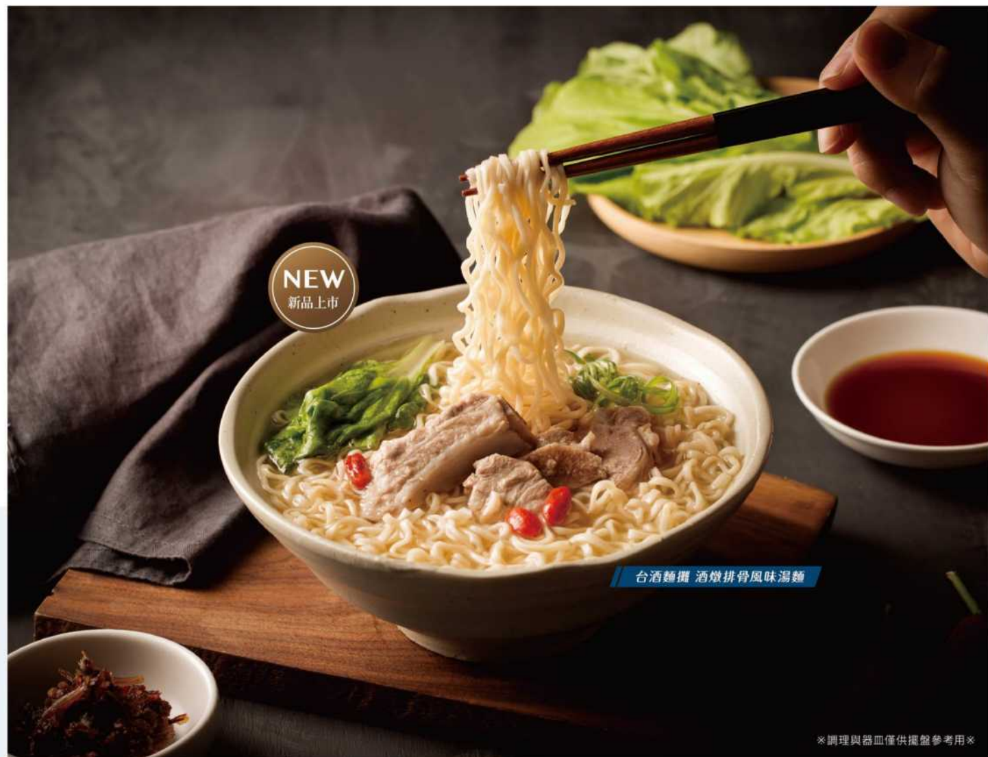
台酒麵攤 酒燉排骨風味湯麵

台酒讓泡麵變成豐盛的講究，以遵循古法釀製的料理酒為點綴，搭配濃郁湯頭及Q彈有勁的麵條，滿足挑剔味蕾的你。