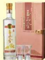
10-04 玉山金黃金高粱酒禮盒