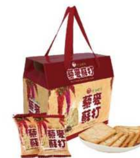
06-21 台酒啤酒酵母藜麥蘇打禮盒