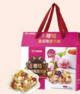
06-18 台酒葡萄蔓越莓腰果酥禮盒