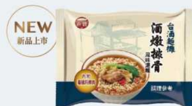
// 07-01 台酒麵攤 酒燉排骨風味湯麵 (袋)

代號: 3502A8-12、容量: 95g*30包/箱 ※調味油包中含豬肉原料(台灣) ※精製豬油(西班牙)