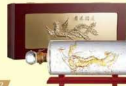
10-02 玉山金黃金高粱酒八年陳高禮盒 (飛鳳騰達)