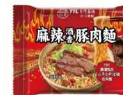
// 07-05 台酒麻辣酒香豚肉麵 (袋)