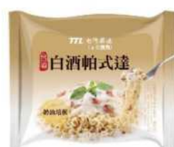
// 07-03 台酒白酒帕式達麵 (袋)