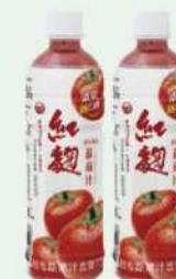
05-03 台酒紅麵蕃茄汁 代號: 351387-12、容量: 570ml*24瓶/箱 全素 $600/箱 (售價840元) 內添加異麥芽寡糖