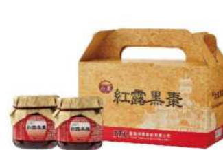
05-01 台酒紅露黑棗禮盒 代號: 340409-12、容量: 600g*2罐/盒 $360/盒 (售價400元) 內添加異麥芽寡糖