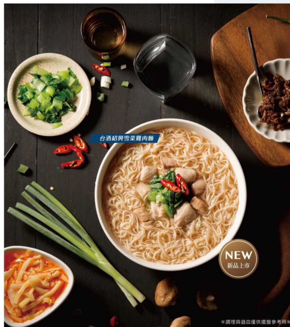
台酒紹興雪菜雞肉麵