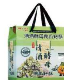
06-23 台酒清酒酵母南瓜籽酥禮盒