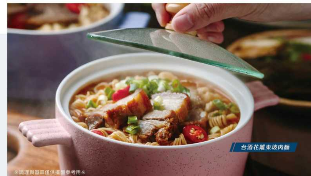
台酒花雕東坡肉麵