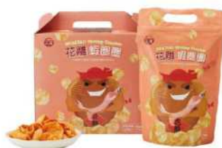
06-17 台酒花雕蝦圈禮盒