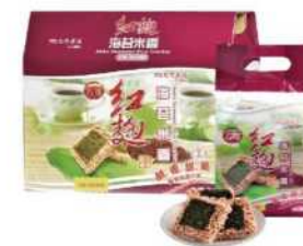
06-22 台酒紅麴海苔米香禮盒