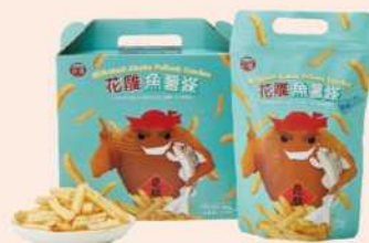
06-16 台酒花雕魚薯條禮盒