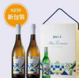
14-05 玉泉台灣之美白葡萄酒禮盒

代號: 224719-14、容量: 0.75L*2+0.18L、酒精濃度: 9.5%