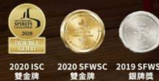
2020 ISC 雙金牌 2020 SFWSC 雙金牌 2019 SFWSC 銀牌獎