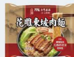
// 07-06 台酒花雕東坡肉麵 (袋)