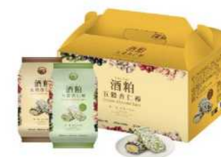
06-20 台酒酒粕五穀杏仁棒禮盒 限量