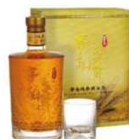
10-06 玉山黃金純麥威士忌禮盒 (麥亂舞)