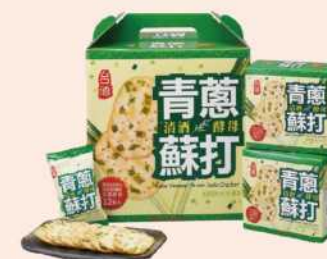
06-19 台酒清酒酵母青蔥蘇打禮盒