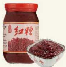
04-05 台酒紅糟醬 限量 代號: 340215-12、容量: 400g/罐 $160/罐 (售價180元)