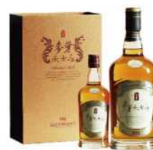
// 13-03 玉尊麥芽威士忌禮盒