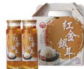
05-02 台酒紅金銀耳禮盒 限量 代號: 351388-12、容量: 235g*6瓶/盒 全素 $380/盒 (售價420元) 內添加異麥芽寡糖