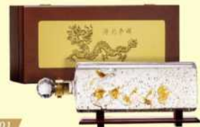
10-01 玉山金黃金高粱酒八年陳高禮盒 (潛龍爭輝)