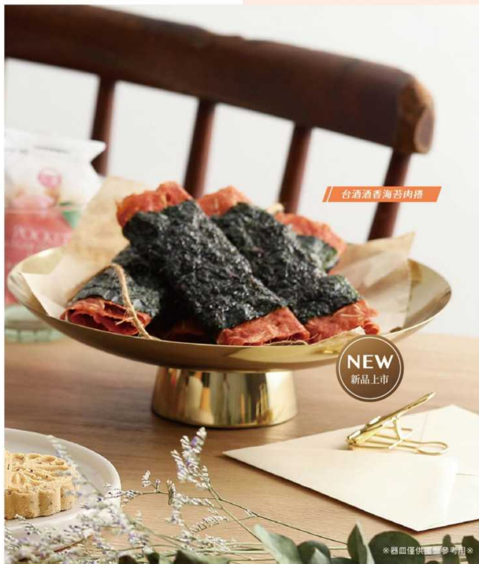
台酒酒香海苔肉捲

過年就是和親朋好友歡聚一堂、敘敘舊， 一邊品嚐美味的零嘴，分享年節的歡樂愉快與喜悅。