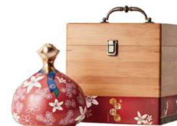
08-04 「富貴桐花」 玉山峯頂珍藏陳高禮盒 限量

酒器採進口雪白極品瓷土，高溫燒製，開口瓶型，頸部以99純黃金水描繪，搭配紅底瓶身白色線條，展現高貴華麗典雅不俗。