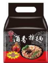
// 07-02 台酒酒香拌麵 (椒麻)