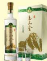
10-05 玉山金黃金六年陳高禮盒