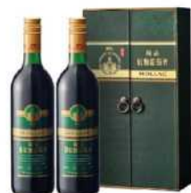
14-02 玉泉極品紅麴葡萄酒禮盒