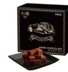
06-25 台酒威士忌生巧克力 限量