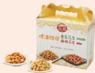
06-15 台酒啤酒酵母花生禮盒