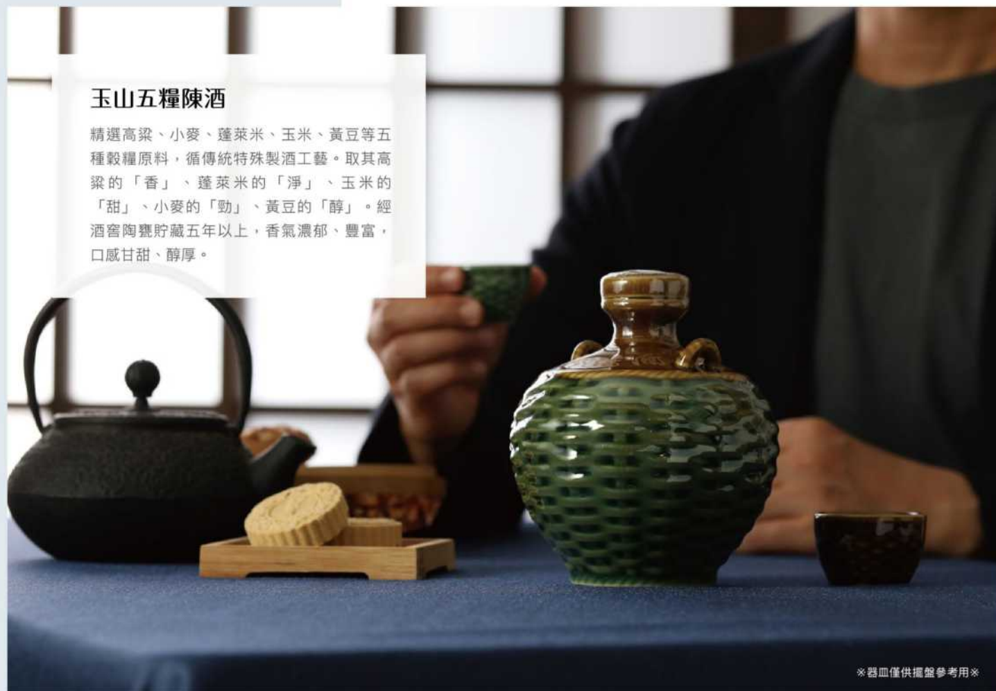
※器皿僅供擺盤參考用※

精選高粱、小麥、蓬萊米、玉米、黃豆等五種穀糧原料，循傳統特殊製酒工藝。取其高粱的「香」、蓬萊米的「淨」、玉米的「甜」、小麥的「勁」、黃豆的「醇」。經酒窖陶甕貯藏五年以上，香氣濃郁、豐富，口感甘甜、醇厚。