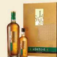
// 13-05 玉尊台灣威士忌禮盒