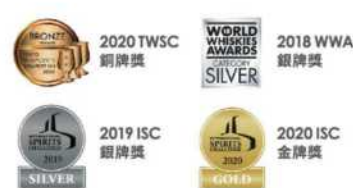
// 13-02 OMAR單一麥芽威士忌禮盒 (波本花香)