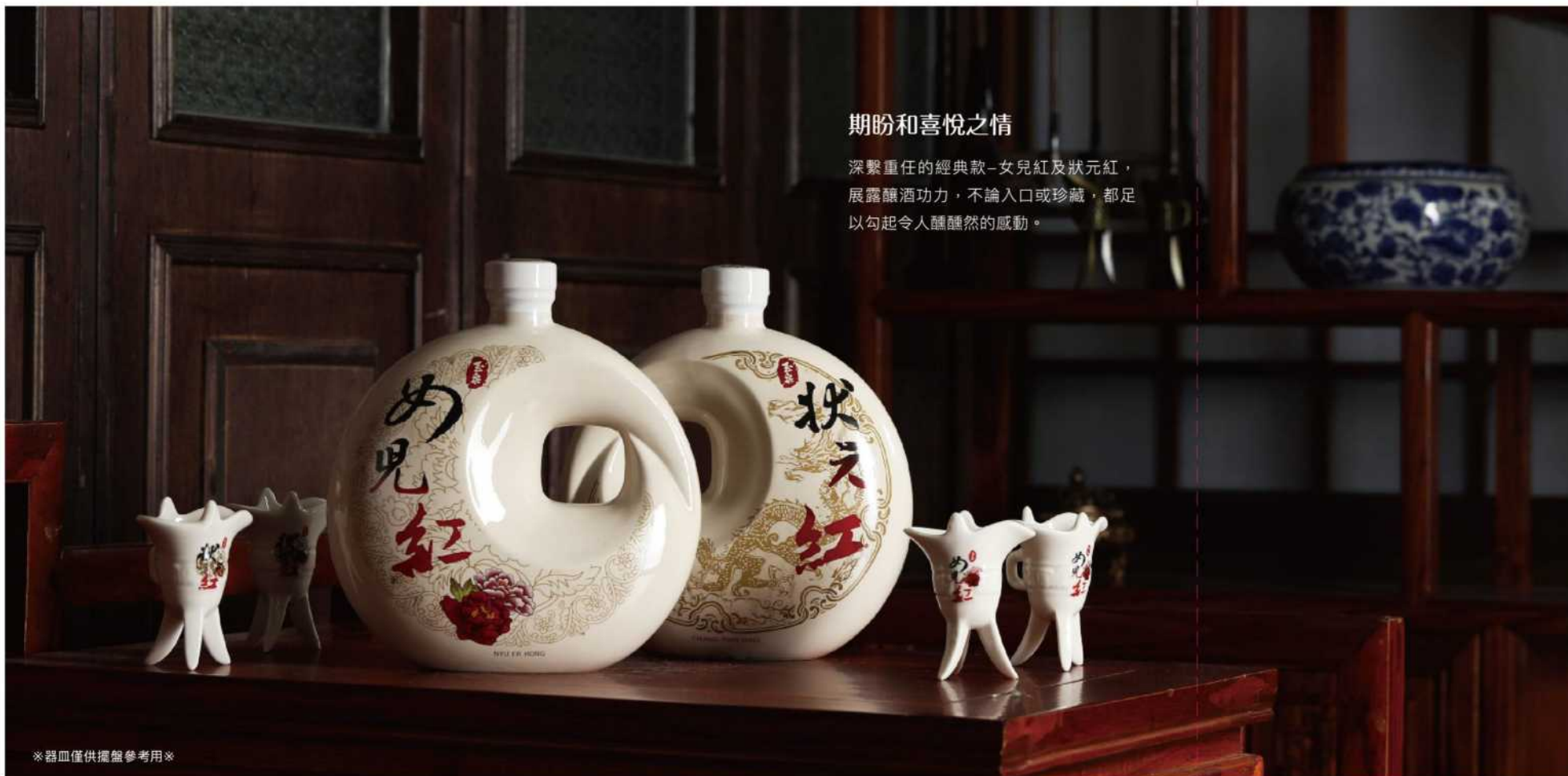
※器皿僅供擺盤參考用※

深繫重任的經典款-女兒紅及狀元紅， 展露釀酒功力，不論入口或珍藏，都足以 勾起令人醺醺然的感動。