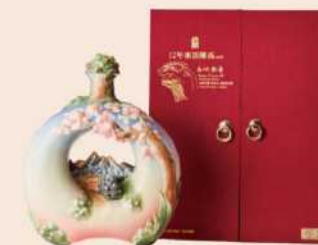
08-06 「巍峨獻壽」 玉山十二年峯頂陳高禮盒 限量

採用法藍瓷為酒器，以台灣著名風景區為創作題材，將阿里山歷史悠久的森林鐵路，與高聳參天的千年神木，雕琢於法藍瓷上，讓自然之美與藝術創作成就一種豐富的藝術文化饗宴。