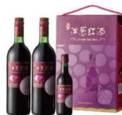
14-01 玉泉洋蔥紅酒禮盒

代號: 22242A-14、容量: 0.75L*2+0.18L、酒精濃度: 10.5%